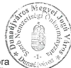
Benkovics Nóra DMJV Szerb Nemzetiségi Önkormányzata elnöke