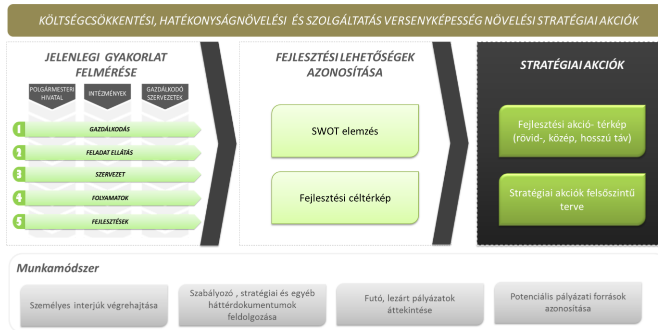
1. ábra Módszertani megközelítés

Jelen dokumentum az ÁROP-1.A.5.-2013-2013-0090 kódszámú pályázat „Önkormányzati Szervezetfejlesztési projekten” belül a 3. sz. Költségcsökkentés, hatékonyságnövelés rövid, közép- és hosszú távú opcióinak és stratégiájának kidolgozása részfeladathoz kapcsolódóan a működési gyakorlat alapján azonosított, vezetői és munkatársai elvárásokból, illetve a kapcsolódó pályázati követelményekből levezetve az Önkormányzat részére költségcsökkentést és/vagy hatékonyságnövelést célzó rövid-, közép, illetve hosszú távú stratégiai akció javaslatokat rögzíti. A dokumentum javaslatot fogalmaz az akciók végrehajtásának felsőszintű ütemezésére, valamint a végrehajtási stratégiára vonatkozóan az alábbiak szerint: