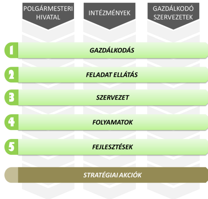
3. ábra Elemzési szempontrendszer

Az önkormányzati működés jelenlegi gyakorlatának áttekintése és értékelése során alkalmazott szempontrendszert az alábbi ábra szemlélteti: