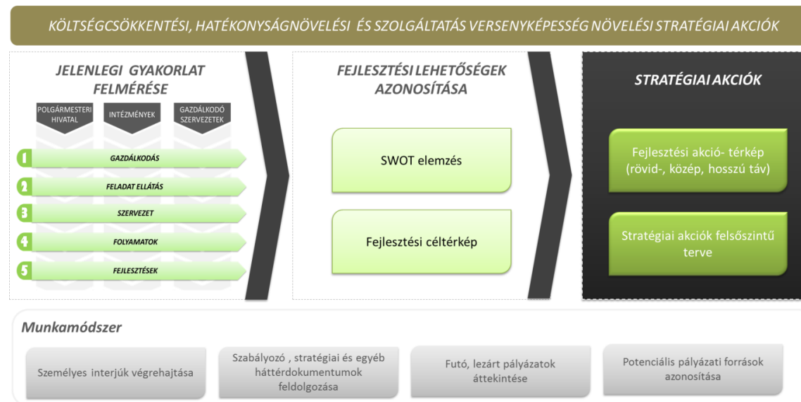
2. ábra Stratégiai akciók tervezésének módszertani megközelítése

Az önkormányzati költségcsökkentési, hatékonyságnövelési, bevétel növelési és szolgáltatásfejlesztési stratégiai akciók kialakításához kapcsolódóan alkalmazott módszertani megközelítésünket az alábbi ábra szemlélteti: