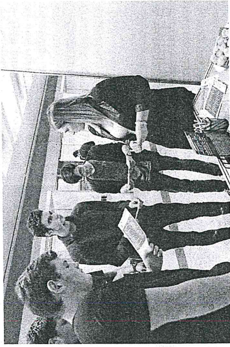
Érdeklődő diákok a kariernapon

sok osztása mellett a cég érdemeinek projektoron történő kivetítésével, a szakmára jellemző dekorációkkal készült, vagy egyenruhában, munkaruhában érkezett. Különlegességek számított, hogy az expón elektromos autókat állítottak ki, amikbe bátran beülhettek a látogatók, valamint a villámszumulátort, és az új területet, a segway-t („kétférekű gördészka”) is.